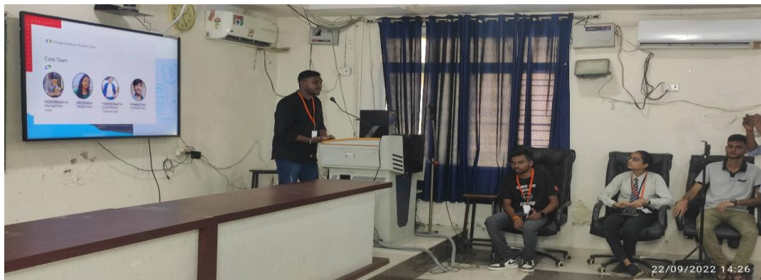
Creative/Social Media Lead